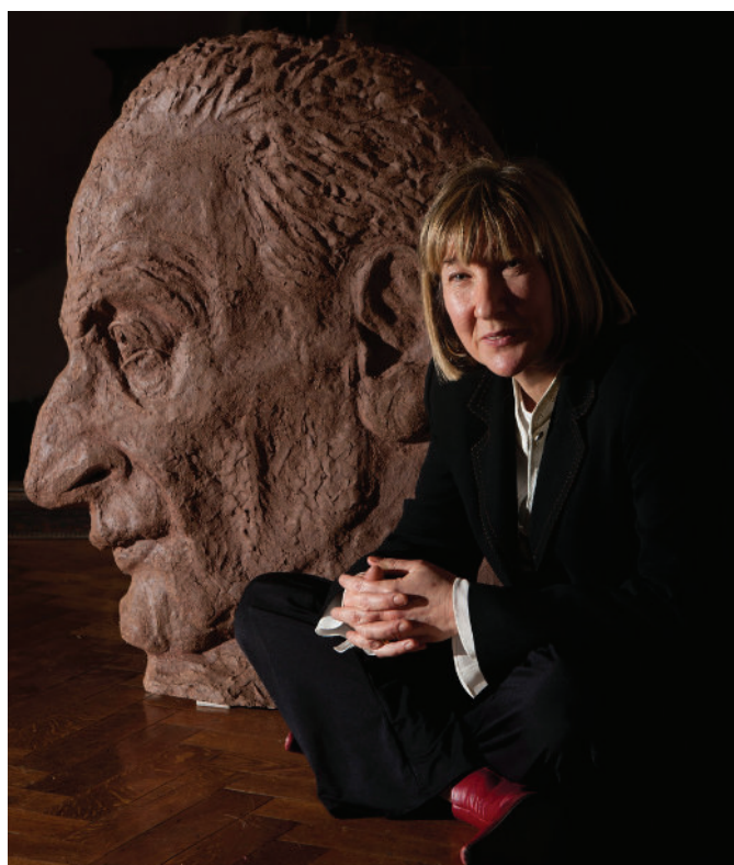
Jane McAdam Freud, Earth Stone Triptych , photographie, 2011, image: Neil Hall.